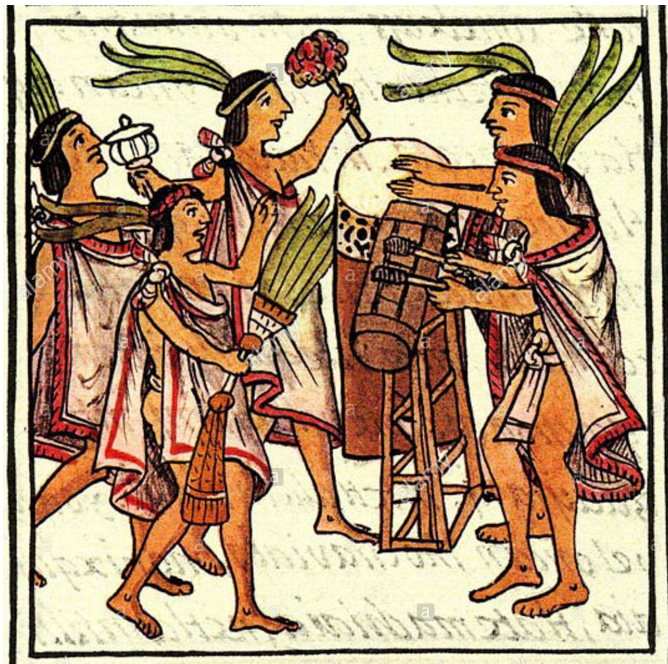
Codice Fiorentino, Secolo XVI Biblioteca Medicea Laurenziana di Firenze