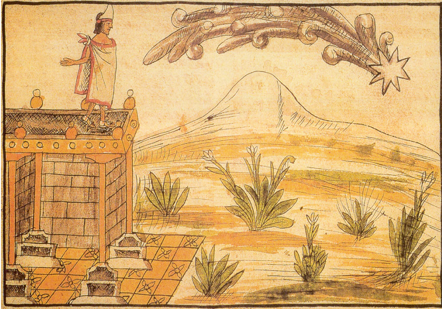
Codice Duràn, Secolo XVI Biblioteca Nacional de España