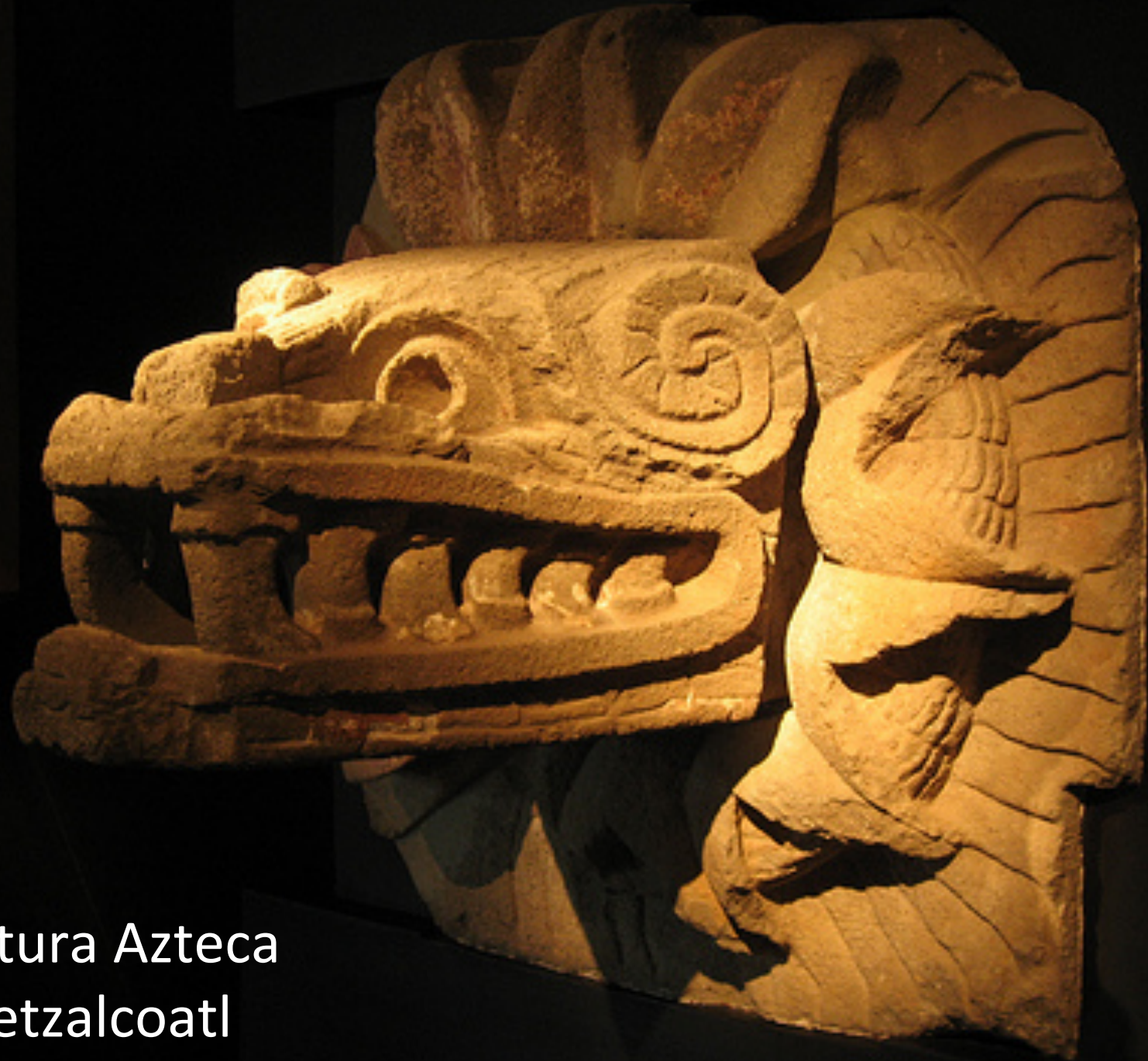
Cultura Azteca Quetzalcoatl